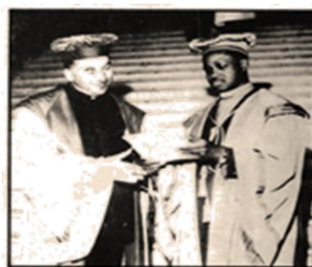
Passation de pouvoir entre Mgr Gillon et Mgr Tshibangu

« Comment rendre grâce au Seigneur pour tous ses bienfaits : J'élèverai la Coupe du Salut, j'invoquerai le Nom du Seigneur »