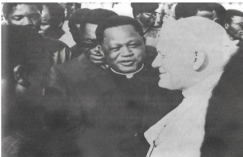
Le Recteur de l'UNAZA lors de la rencontre du Pape Jean-Paul II avec les intellectuels de Kinshasa, en 1980.

« Chacun de nous en son Existence a fini, au-delà d'un certain âge, par se déterminer un idéal et des objectifs globaux à poursuivre, sorte « Positions fondamentales de la Vie ».